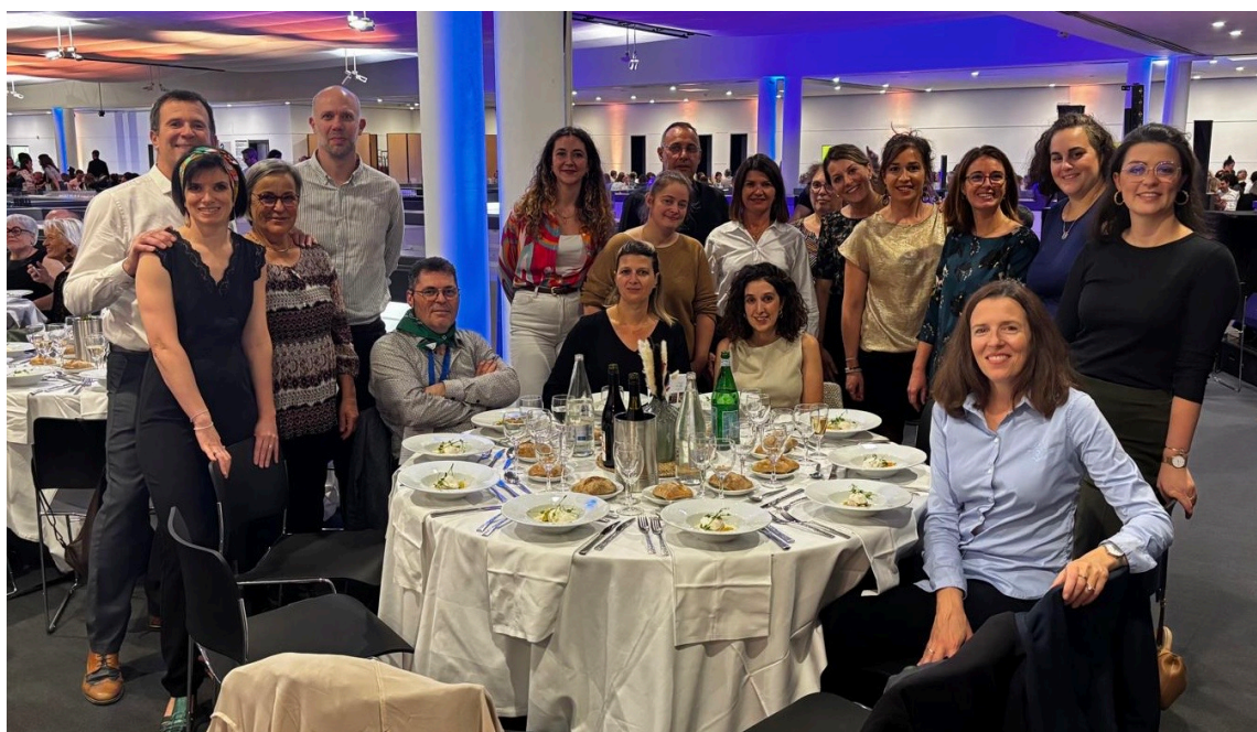
Les CPTS de Haute-Loire, lors des journées nationales à Montpellier

➡ Les 5 et 6 novembre , les responsables de la CPTS se sont rendus à Montpellier aux journées nationales des CPTS .